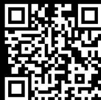
乃木小学校「水の偉人」書籍贈呈式 [Youtube 1時間 10分]