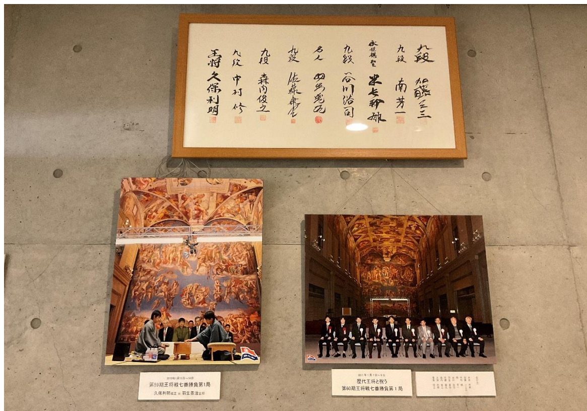
第 59 期王将戦 第一局